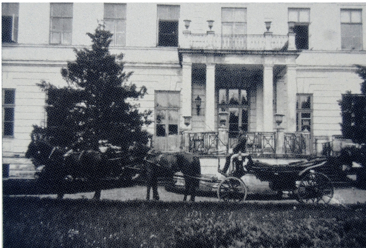
Il. 11 Wieniec - Pałac Kronenbergów – widok na fragment elewacji frontowej –30 lata XX w.